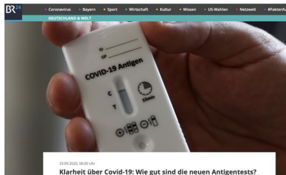
29.09.2020, 06:30 Uhr Klarheit über Covid-19: Wie gut sind die neuen Antigen-tests?