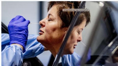
Antigen-tests auf das Coronavirus sollen künftig vor allem dem Fremdschutz dienen - und verhindern, dass sich besonders gefährdete Personengruppen mit dem Virus anstecken. Wie beim PCR-Test braucht es dafür einen Nasen-Rachenabstrich.